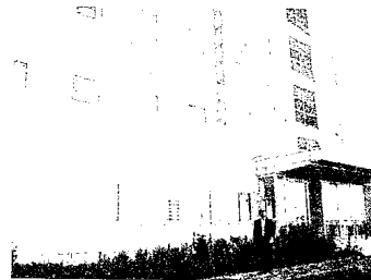
北大・次世代ポストゲノム研究センター

この間、主としてスフィンゴ脂質生理機能やそれに基づく応用研究を展開、Nature、MBC、MCB、PNAS、JCB、Blood、FASEB、J、JBCなどを含む一流国際誌に200報以上の原著論文を発表、50回以上におよぶ国際会議での招待講演など世界の第一線で活躍してきた。文科省特定領域研究「スフィンゴ脂質」(平成12~16年度)の領域代表を務め、日本におけるスフィンゴ脂質研究のリーダーとして活躍、また、平成16年には札幌での国際スフィンゴ脂質シンポジウム、19年には日本脂質生化学会を成功させ、国際脂質生化学会(ICBL)の日本代表理事、日本生化学会理事、BBAなどの編集委員として脂質研究の発展に尽力してきた。これらの成果と北海道における生命科学研究所発展の貢献により、平成19年に北海道科学技術賞を受賞。平成20年4月から、文科省未来創薬未来医療イノベーション事業、知的クラスターサッポロBio-S事業の研究統括、JSTプラザ育成事業の研究代表者などの任務を継続。また22年の内藤財団国際シンポ「膜脂質ダイナミクス」の組織委員長、24年のゴードン会議「Glycolipid and Sphingolipid Biology」の会長に選出されている